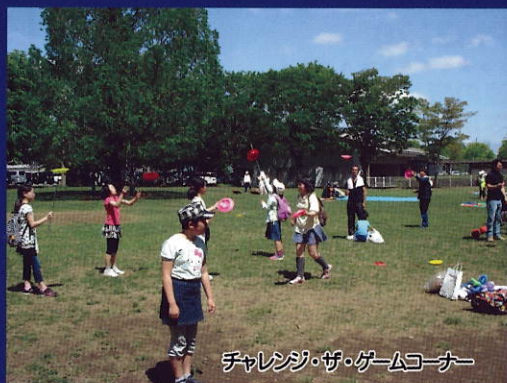
チャレンジ・ザ・ゲームコーナー