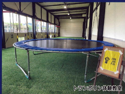
トランポリン体験教室