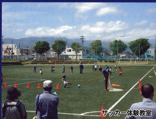
サッカー体験教室