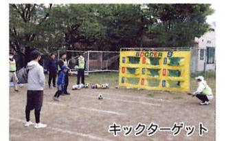
キックターゲット