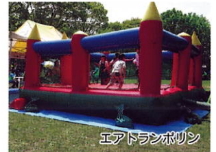
エアトランポリン